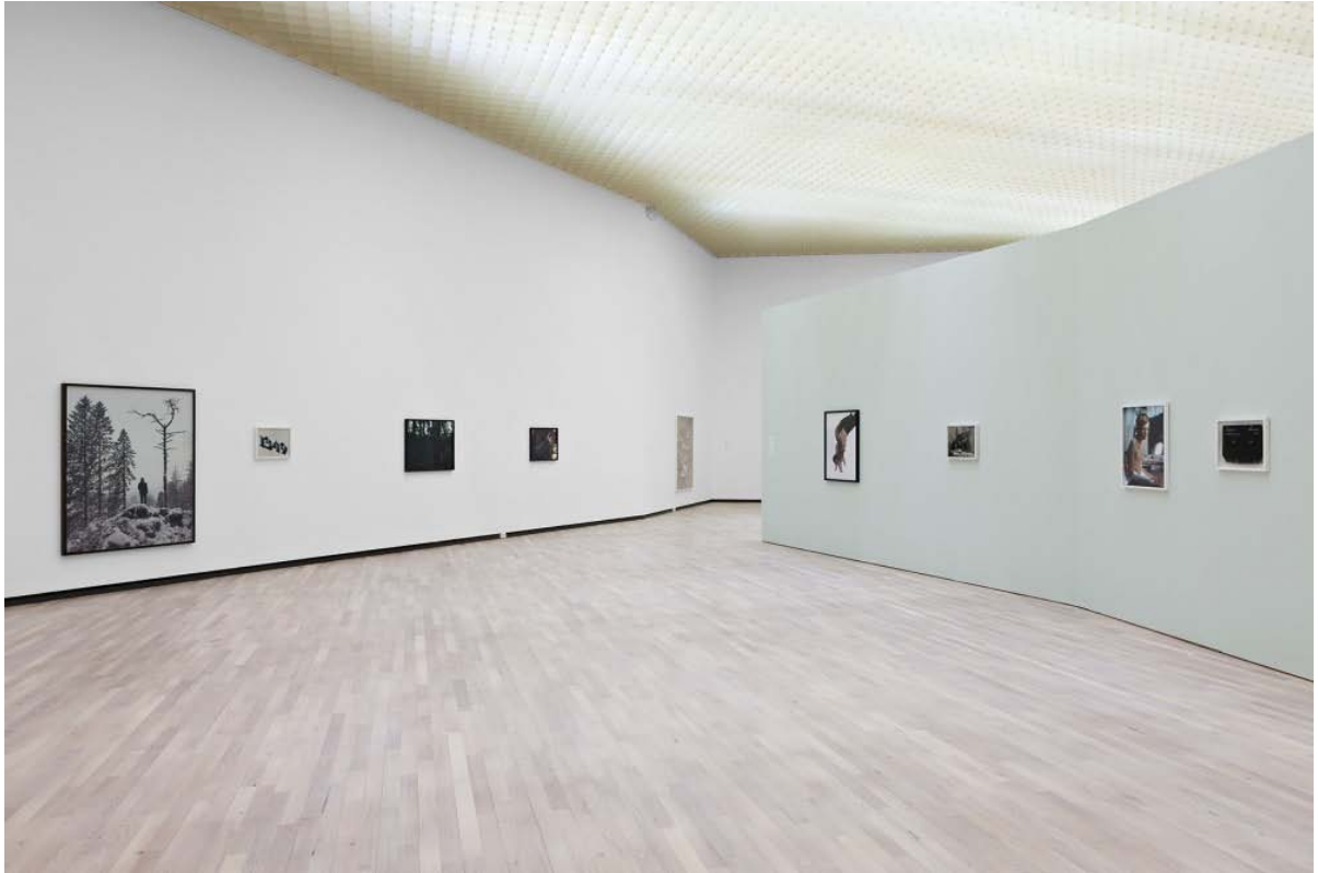
Torbjørn Rødland, Sasquatch Century , 2015. Installation view. Henie Onstad Kunstsenter, Oslo.

Sasquatch Century vises på Henie Onstad fra 23.01 til 26.06.