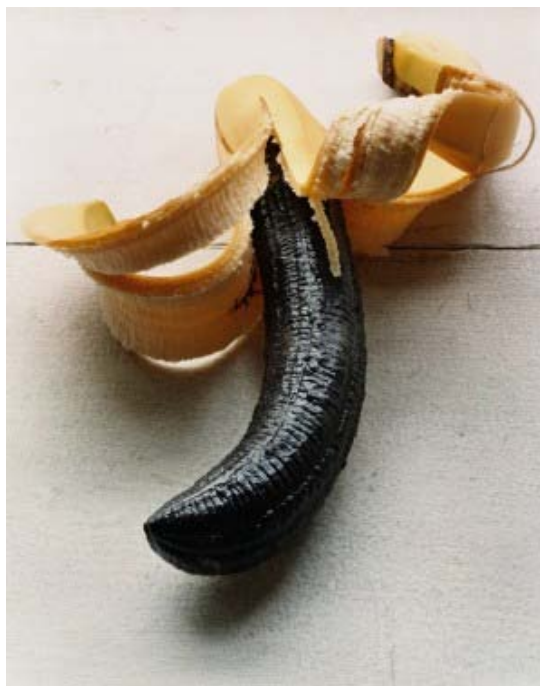
Torbjørn Rødland, Banana Black , 2005. Fra Sasquatch Century på Henie Onstad Kunstsenter

I forbindelse med Sasquatch Century kommer man ikke helt unna å nevne den utmattede natur/kultur dikotomien. Det er heller ikke unaturlig når man skal undersøke produksjonen til en kunstner som oftest assosieres med de etterhvert notorisk kjente fotoseriene In a Norwegian Landscape , det ensomme mennesket med en plastpose i norske kulturlandskap og Black med fotografier av musikere fra Norges Black Metal miljø i skogen. I utstillingen er disse fotografiene tatt ut av sin opprinnelige kontekst, og satt sammen på måter som mer ser dette skillet mellom mennesker og kultur mot natur som en fusjon snarere enn en motsetning. I Frost no. 4 (2001) griper en naglebektedd arm rundt en trestamme nærmest kjærlig og i Frost no. 2 (2001) sitter samme sortkledde figur sammenkrøpet mellom trestammene som en mystisk skapning, ifølge kurator Milena Høgsberg nærmest en urban kriger, en moderne representasjon av sasquatchen. Natur/kultur dikotomien er i alle tilfelle et enkelt halmstrå å gripe fatt i ved første øyekast, de mer mystiske understrømmene i fotografiene tar først overhånd når man har sett bildene og sett igjen, og begynner å koble verk på tvers av rom og innhold.