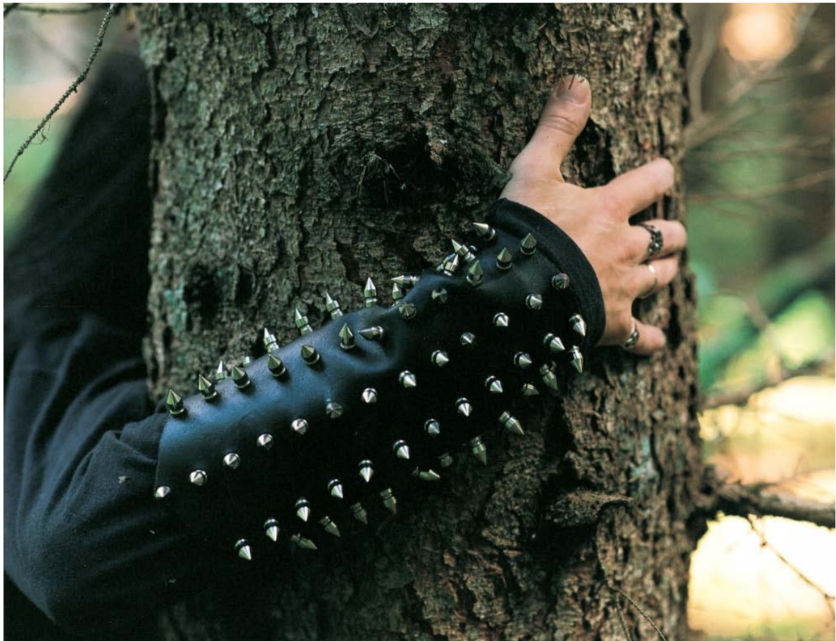
Torbjørn Rødland, Frost no. 4, 2001. Fra Sasquatch Century på Henie Onstad Kunstsenter