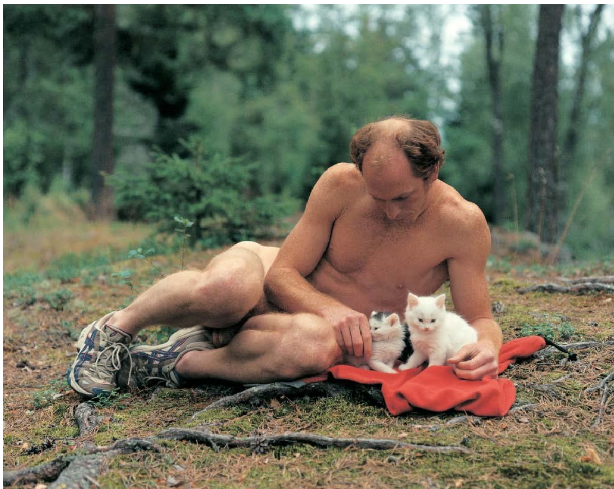
Torbjørn Rødland, Nudist no. 6, 1999. Fra Sasquatch Century på Henie Onstad Kunstsenter

Å se Torbjørn Rødlands utstilling Sasquatch Century på Henie Onstad Kunstsenter med et halvt øye på smarttelefonen, er å gjøre seg selv en bjørnetjeneste.